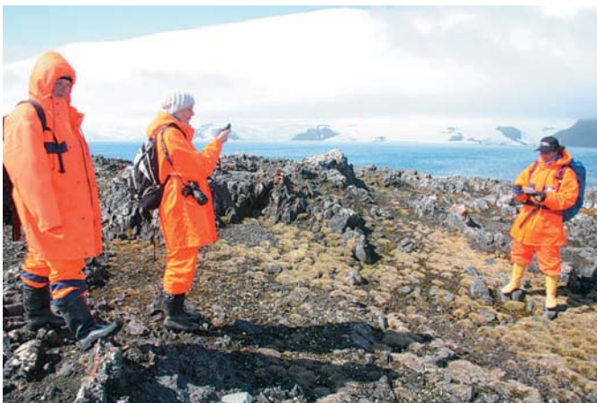
Abb. 2: Kartierung der Antarktischen Schmiele, einer von zwei Blütenpflanzenarten auf King George Island

Auch an der Vegetation lassen sich die Veränderungen des Klimas deutlich ablesen. Die wärmeren und längeren antarktischen Sommer haben beispielsweise zu einer enormen