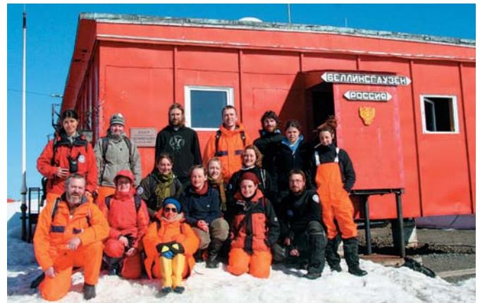
Abb. 1: Expeditionsteilnehmer vor dem Hauptgebäude der russischen Bellingshausen-Station auf King George Island.

Die Weihnachtszeit ist für Polarforscher, die in der Antarktis arbeiten, traditionell Reisezeit. Am Heiligabend flog der erste Teil der Gruppe in Richtung Südamerika ab, um von Ushuaia aus die Antarktis per Schiff zu erreichen. Anfang Januar kam wenige Tage später eine zweite Gruppe auf King George Island an. In der Station Bellingshausen (Abb. 1) wurden die Studierenden herzlich empfangen. Als Unterkunft wurde ein