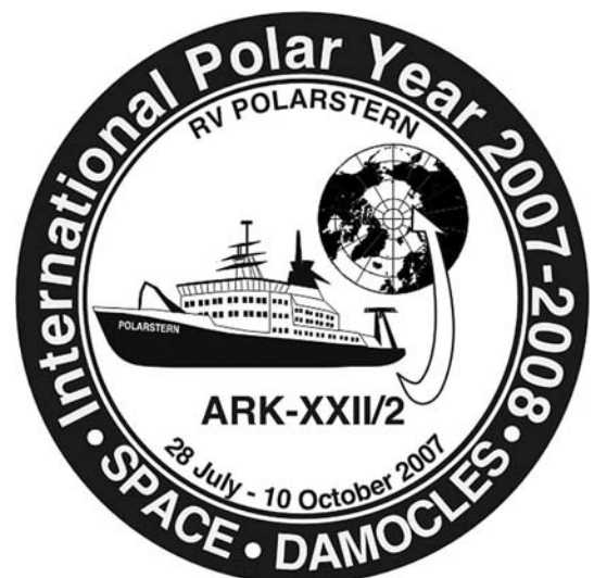
Abb. 1: Logo der Polarstern-Expedition ARK-XXII/2 mit dem IPY-Programm SPACE (Synoptic Pan-Arctic Climate and Environment Study) und dem EU-Programm DAMOCLES (Developing Arctic Modelling and Observation Capabilities for Long-term Environment Studies).

Zur Beantwortung dieser wesentlichen Fragen wurde im IPY 2007/08 neben anderen arktischen Expeditionen die Polarsternfahrt ARK-XXII/2 durchgeführt (Abb. 1), die insbesondere die eurasische und zentrale Arktis erfassen sollte. Um dekadische Veränderungen zu erfassen, wurden im Eurasischen Becken Wiederholungsmessungen zu „Polarstern“- und „Oden“-Kampagnen von 1991, 1993, 1995, 1996 und 2005 durchgeführt. Das ozeanographische Programm ist Teil des EU-Projektes DAMOCLES (Developing Arctic Modelling and Observation Capabilities for Longterm Environmental Studies, vgl. Folge 10).