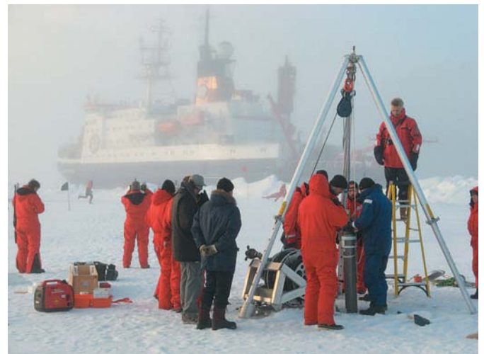
Abb. 3: Ein internationales Team beim Ausbringen einer Eisboje. Die von der Boje getragene Sonde misst jeden Tag ein Profil der Temperatur und des Salzgehalts bis in 800 m Tiefe und sendet die Daten per Satellit an Land (Foto: K. Bakker, NIOZ).

Über dem Kontinentalabhang wurde durch die Framstraße einfließendes Wasser mit wieder höheren Temperaturen und